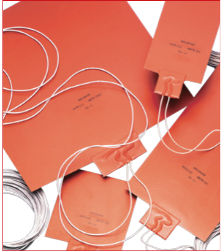
图 1. 带有硅基板的绕线柔性加热器。

使用纤薄且柔韧的硅胶/玻璃纤维织物复合材料是高温加热器的标准设计。罗杰斯公司生产全系列的硅胶/玻璃纤维织物复合材料，其经 UL 认证的相对热指数 (RTI) 达 220°C (428°F)，具有横向燃烧 (HB) 阻燃等级，并且具有柔性加热器电气绝缘的垂直燃烧最高阻燃等级 (UL94V0)。这些材料适用于预粘接电阻箔片，如 Inconel 600 和不锈钢。这消除了初始粘合步骤，从而降低加工成本。无论是用于绕线式还是蚀箔式加热器，罗杰斯公司的硅胶/玻璃纤维复合材料都能可靠工作，并提供较长的使用寿命。